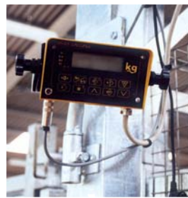
Pesée transaction commerciale CLASSE III

La cage de pesée broutard est une section de couloir suspendue.